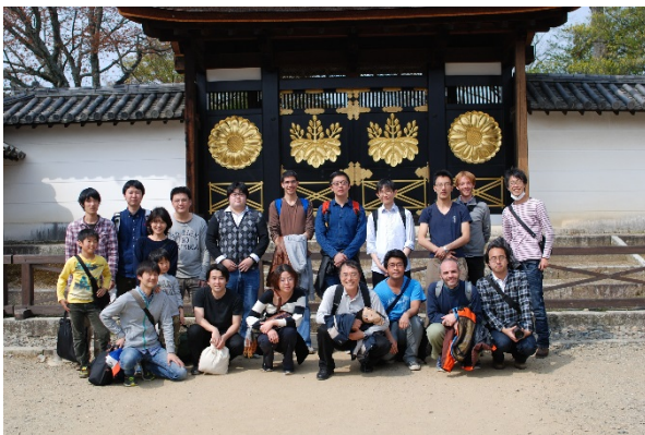
研究室ハイキング(春)@京都 醍醐寺

ブラックホールや中性子星などの相対論的天体同士の衝突のような、強重力場のもとでの複雑な現象に対するアプローチに、一般相対論と数値シミュレーションを組み合わせた、数値相対論がある。数値相対論を用いて、相対論的天体の衝突で生じる重力波の波形を予測をおこなっている。現在、KAGRAなどの次世代重力波望遠鏡を建設中であり、人類初の重力波検出、および強重力場の物理の理解が期待されている。また、最近では高次元時空でのシミュレーションも行っている。