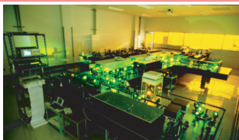
超高強度極短パルスレーザーT6-laser

また、短パルスレーザーの発展により、小型でも極めて高い光強度を実現することが可能となりました。レーザー物質相互作用の物理に興味もたれる光場強度の範囲がさらに高いほうに広がっています。対応する電磁場の強さは原子中の場よりも高くなり、このような電磁場中では電子の運動は相対論的になり、MeV以上に容易に加速されます。この高エネルギーイオンの運動による短パルスの高エネルギーx線やイオンを発生する新しい現象が研究されています。レーザー生成放射線はパルス、点源、高強度といった特徴を有し、新しい放射線源への潜在能力が期待されます。